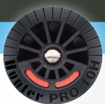
PRO-SPRAY-DÜSEN MIT FESTEM SEKTOR