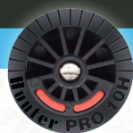
PRO-SPRAY-DÜSEN MIT FESTEM SEKTOR